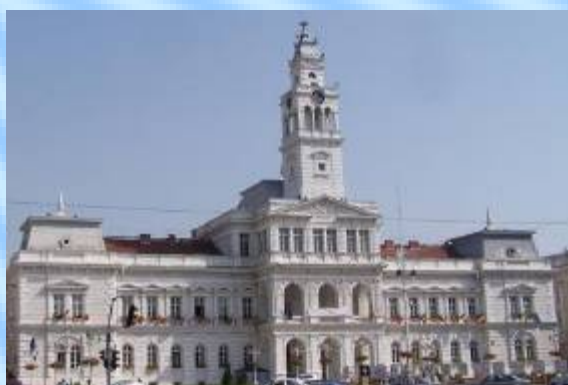
- Primăria Arad în stil neorenescentist flamand

În centrul orașului am vizitat: Teatrul de Stat Ioan Slavici” în stil neoclasic, Catedrala Ortodoxă cu fresce în stil bizantin.