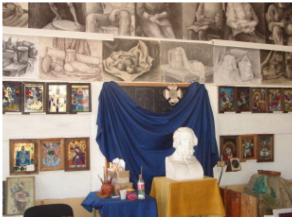
ATELIER ARTE PLASTICE