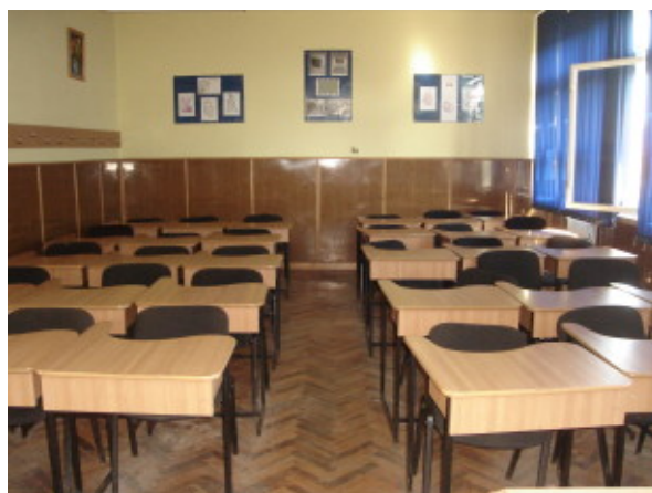
SALĂ DE CLASĂ