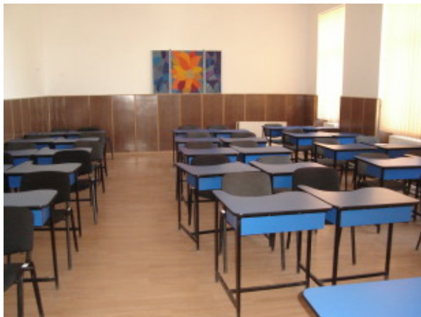
SALĂ DE CLASĂ