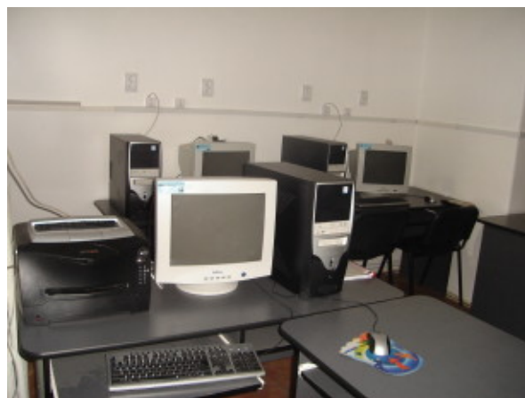
CLUBUL INTERNET ȘI FIRMA DE EXERCİȚIU