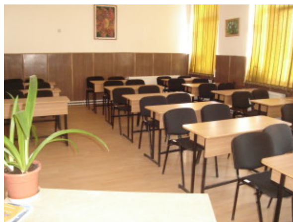
SALĂ DE CLASĂ