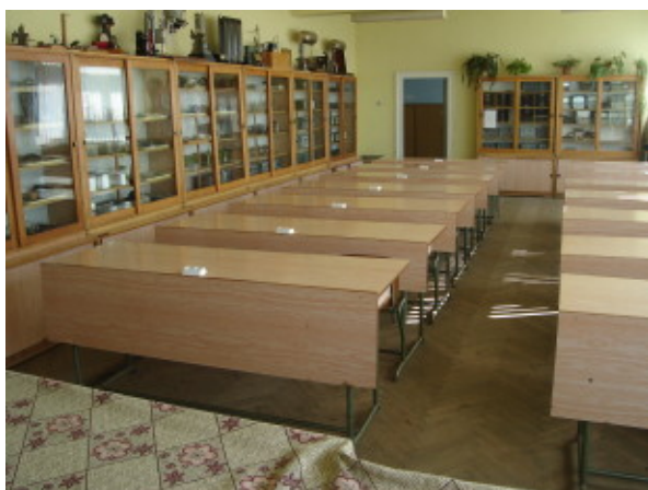
LABORATOR DE FIZICĂ