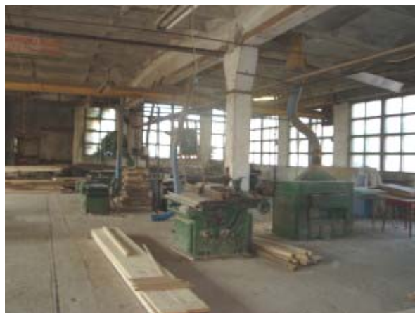
HALA DE MAȘINI