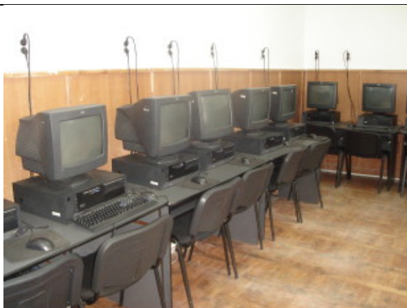
LABORATOR 1 DE INFORMATICĂ