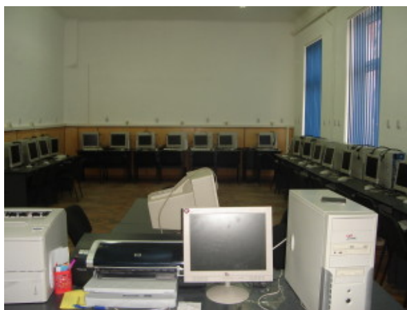
LABORATOR 2 DE INFORMATICĂ